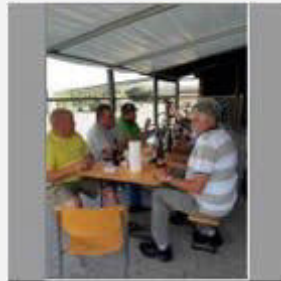
Diskussionen + Debatten