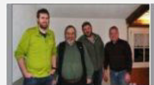
die neuen Ehrenmitglieder

Die besten Resultate des Jahres 2017 - ein Rückblick