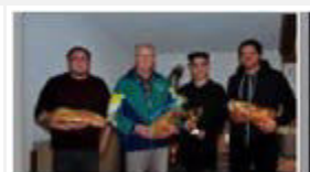
alle Gewinner mit